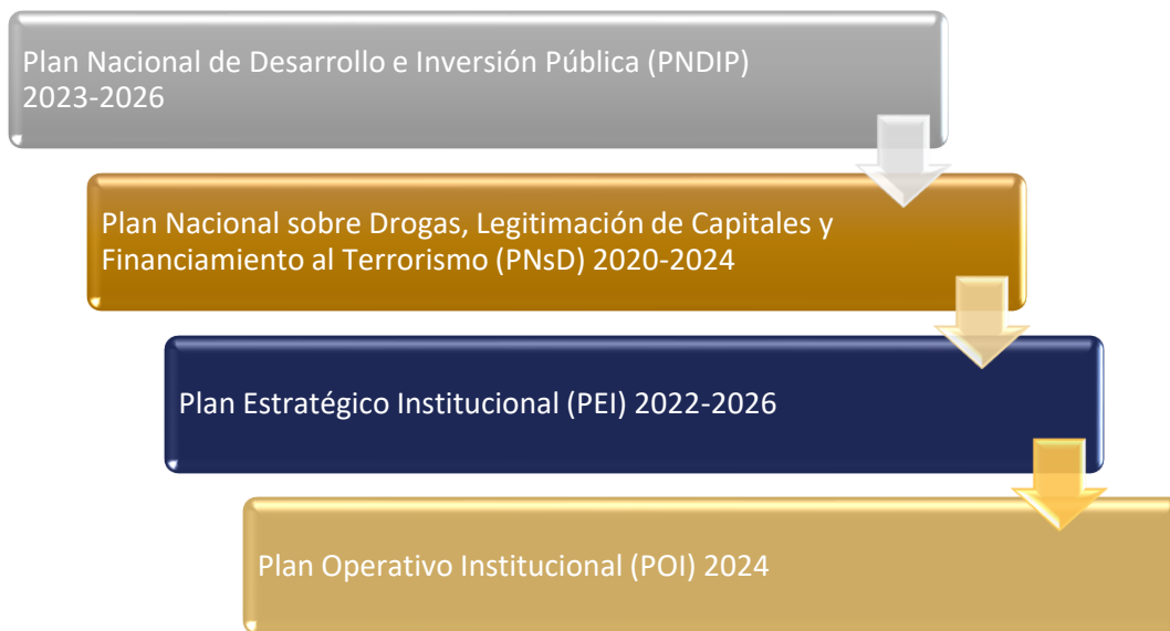
Figura 1. Planificación estratégica y operativa del ICD

Para este 2024, el POI incorpora los compromisos anuales planteados por parte de la Contraloría de Servicios Institucional, así como de las diversas comisiones y comités existentes.