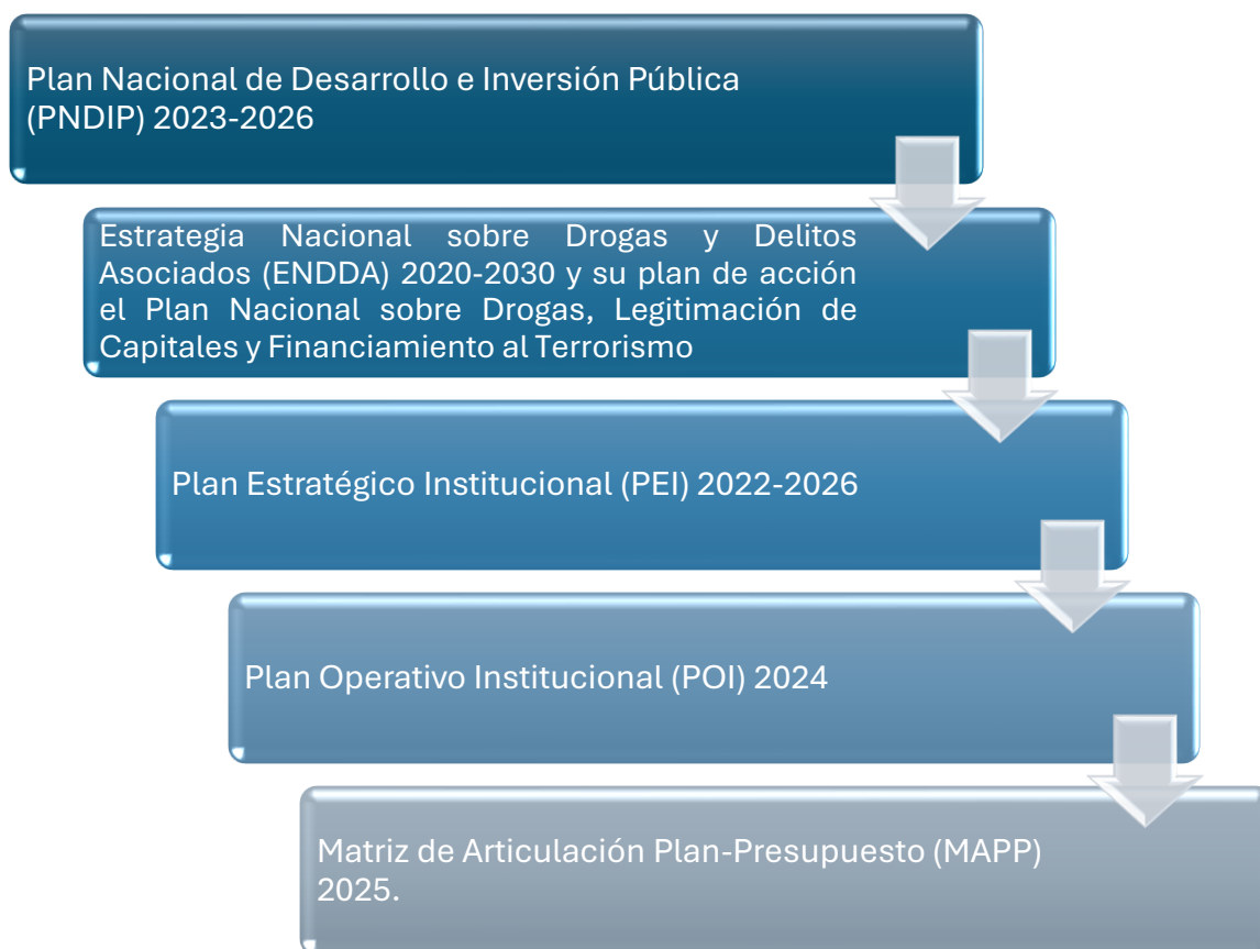
Figura 1. Planificación estratégica y operativa base del POI-ICD, 2025

Además de la producción de las unidades institucionales, el POI de este 2025 incorpora la programación presupuestaria requerida para la implementación de los compromisos anuales, e incluye un apartado con los proyectos de inversión pública vigentes.